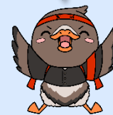
みやぎハローワークキャラクター ガンちょーさん