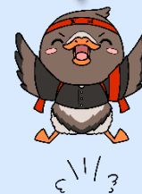
みやぎハローワークキャラクター ガンちょーさん