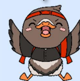
みやぎハローワークキャラクター ガンちょーさん